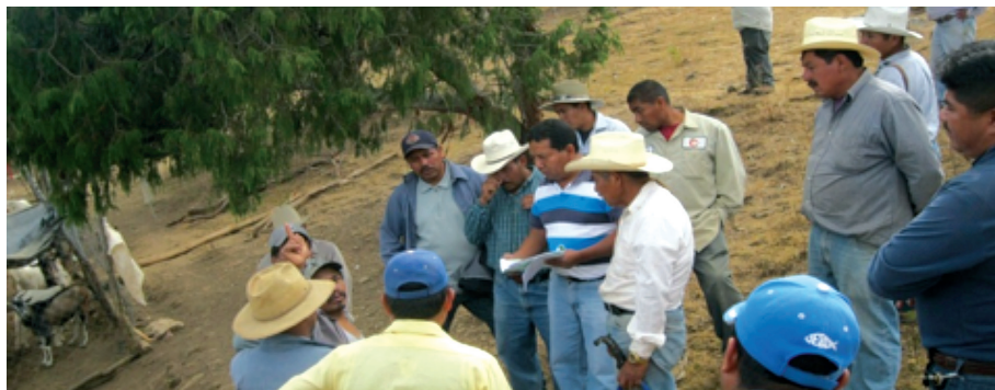
Diligencia del Defensor Regional de Juxtlahuaca con Campesinos.

E n los casos en que la Defensoría determina la existencia de violaciones a derechos humanos, si estas no son de gravedad, tiene facultades para promover propuestas de conciliación, y si son calificadas como graves, se emiten Recomendaciones pertinentes, en ambos casos son dirigidas a las autoridades responsables con la finalidad de restituir el derecho humano transgredido, y solicitar la aplicación de las sanciones administrativas o penales correspondientes a los servidores públicos involucrados, así como la reparación del daño y la garantía de no repetición de la falta.