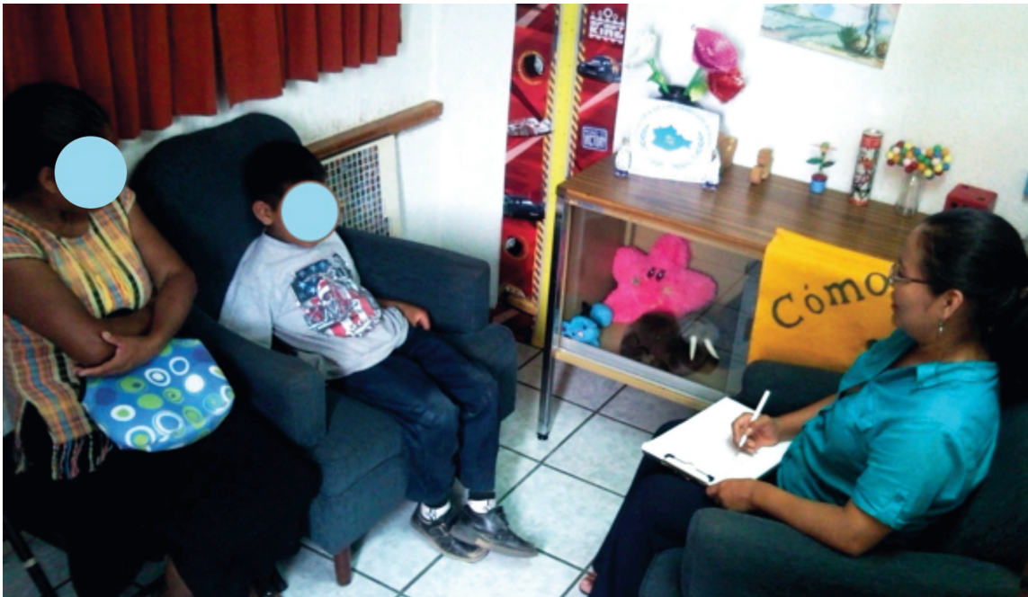
Atención psicológica a víctimas de violaciones de derechos humanos.

Se presentaron 56 informes psicológicos especiales en respuesta a las quejas interpuestas por la ciudadanía, con los cuales se atendió a igual número de personas de los siguientes municipios e instituciones.