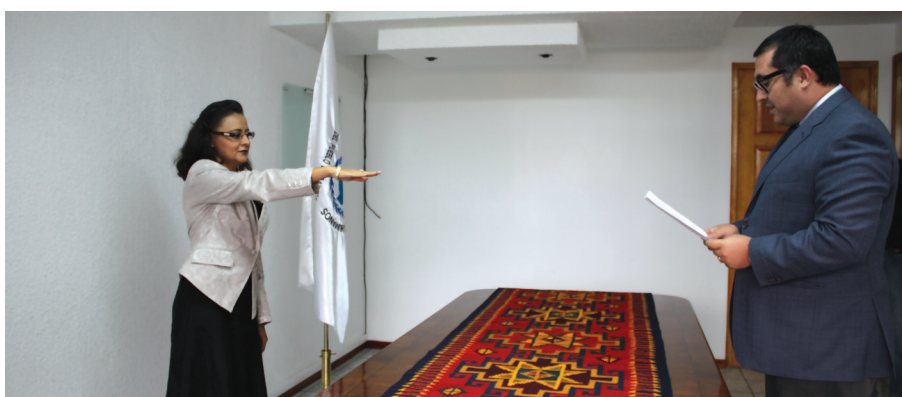
Toma de protesta a nueva funcionaria de la DDHPO.

Mediante acuerdos tomados entre el titular de la Defensoría y los integrantes del Consejo Ciudadano, en consideración a la disponibilidad presupuestal existente, se realizó la selección de los servidores públicos que fueron designados en la nueva estructura del Organismo, donde se buscaron los mejores perfiles de profesionales que se han destacado por su trayectoria en la defensa de los derechos humanos en todo el territorio del estado.