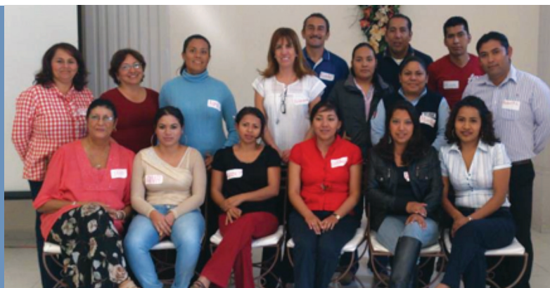
1. Capacitadores de la Defensoría certificados por el CONOCER. 2. Personal de la Defensoría asistentes al taller “Atención prioritaria a la mujer migrante y sus familias”.